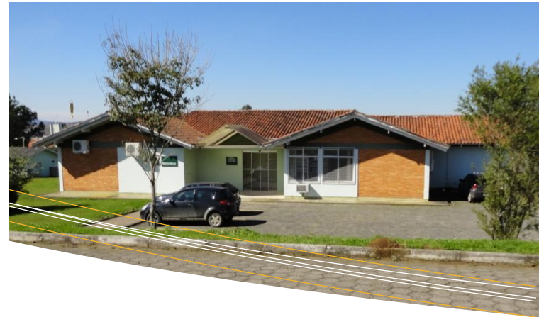
Biblioteca CAV – Lages

LEVANTAMENTO BIBLIOGRÁFICO: É o serviço de pesquisa no acervo da UDESC, de outras Instituições ou em diferentes bases de dados de fontes/bibliografias sobre um determinado assunto ou autor. O usuário poderá também realizar o acesso à bases de dados on-line ou CD-ROM, na biblioteca, sem o auxílio do bibliotecário, em horário previamente agendado. Este serviço é oferecido somente para os usuários vinculados à UDESC.