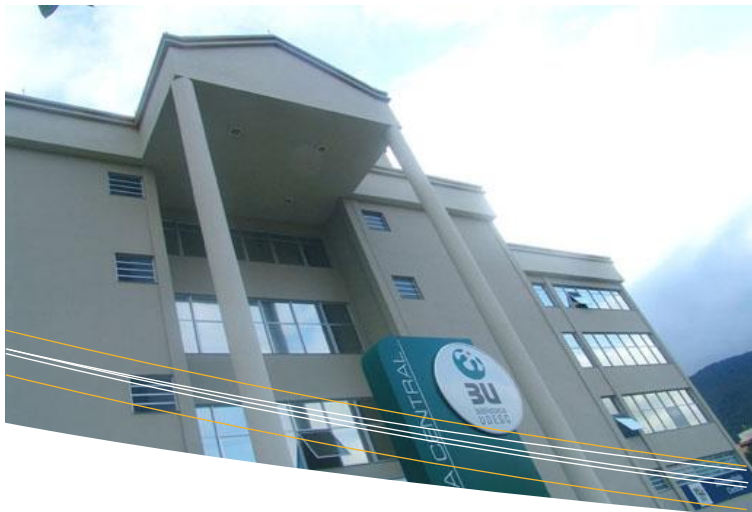
BU e Biblioteca Central – Florianópolis