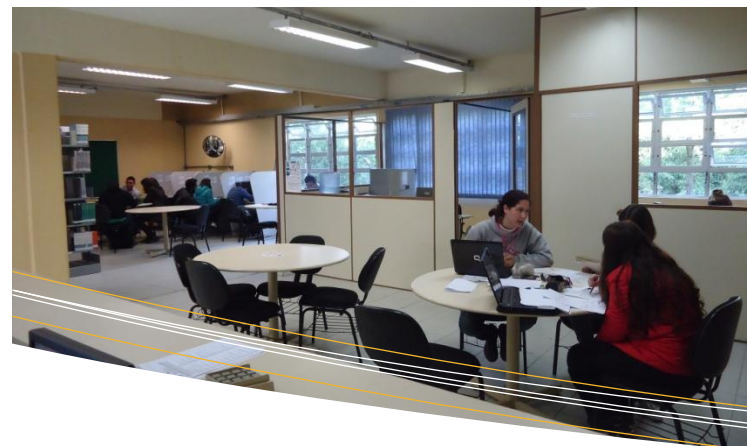
Biblioteca CEPLAN – São Bento do Sul

VISITA ORIENTADA: Orientação de grupos de alunos e/ou de diferentes Instituições sobre a utilização do acervo e serviços da Biblioteca. É necessário agendar a visita com antecedência.