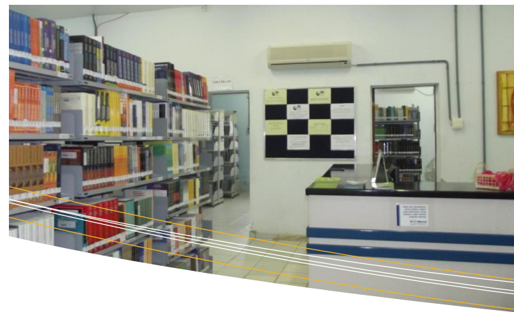
Biblioteca CEAVI – Ibirama

BANCO DIGITAL DE TESES DA UDESC: disponibiliza a produção científica dos programas de pós-graduação da Universidade (mestrado e doutorado). Todos os trabalhos deverão estar disponíveis, via internet, no Banco Digital de Teses da UDESC.