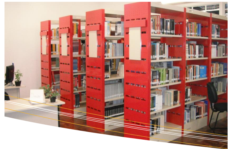
Biblioteca CERES – Laguna

Seu acervo é composto por mais de duzentos mil itens entre materiais como livros, monografias, dissertações, partituras, CDs, DVDs, fitas e mapas.