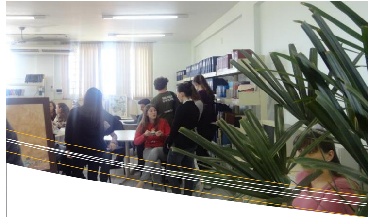
Biblioteca CEO – Pinhalzinho

INTERCÂMBIO BIBLIOTECÁRIO: É um serviço que visa ampliar as possibilidades de acesso as informações através do contato e troca de informações/materiais com outras Instituições e acervos, na medida do possível. O empréstimo de materiais bibliográficos entre instituições deverá ser realizado mediante convênio previamente celebrado.